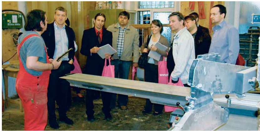
S příklady dobré praxe sociálního podnikání se seznámili zástupci českých a moravských měst i během studijní cesty v Rakousku.

Deset českých a moravských měst zapojených do mezinárodního projektu Sociálně odpovědné municipality má v plánu snížit místní nezaměstnanost prostřednictvím sociálního podnikání nebo odpovědného zadávání veřejných zakázek.