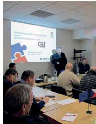
Zaměstnanci Státního úřadu inspekce práce byli uvedeni do problematiky CAF na informačním semináři.

V rámci projektu se uskuteční vzdělávací aktivity směřující k získávání nových znalostí a dovedností v oblasti hodnocení chodu organizace a znalostí nutných ke zlepšování organizace pomocí sebehodnocení