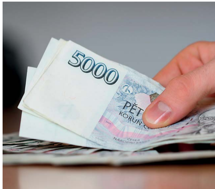
Sociální reforma má především snížit náklady na administraci systému.