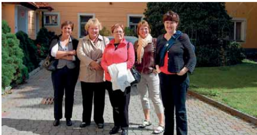
Pětičlenná islandská delegace navštívila i domov pro seniory v jihočeském Chýnově.

V první polovině září strávilo v ČR sedmidenní studijní pobyt pět odborníků na sociální služby z Islandu. Šlo o druhou aktivitu projektu Asociace poskytovatelů sociálních služeb České republiky (APSS ČR) a islandské partnerské organizace Soltun Nursing Home s názvem Komparace služeb sociální péče o seniory .