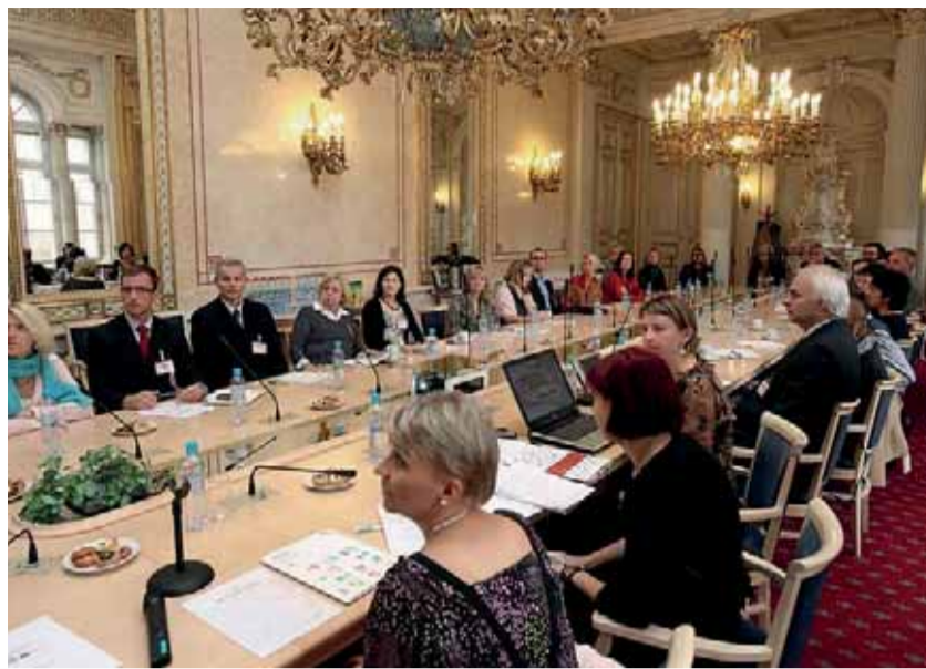
Vyhlášení a předání cen soutěže Národní cena kariérového poradenství 2010 proběhlo ve Velkém zrcadlovém sále Ministerstva školství, mládeže a tělovýchovy ČR.

2. místo: Úřad práce v Náchodě s příspěvkem Pravidelné středeční poradenské schůzky pro evidované klienty