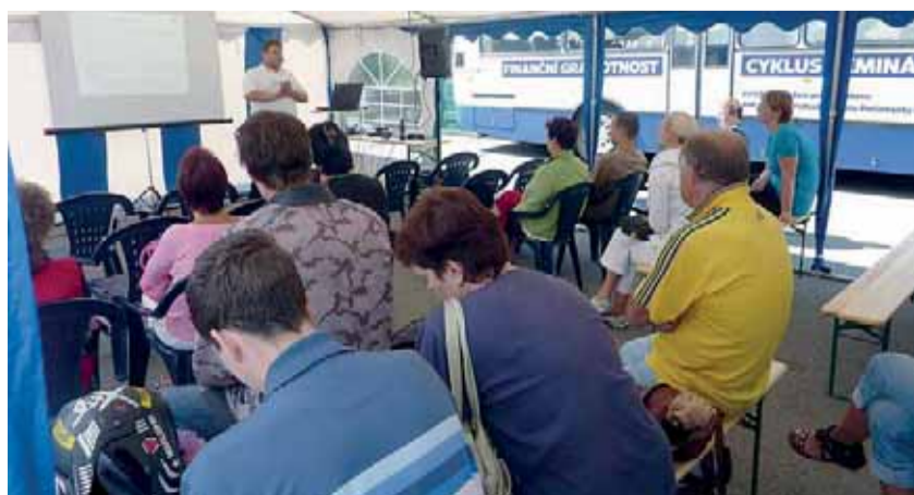
Cílem seminářů Úřadu práce v Liberci na téma finanční gramotnost bylo zvýšit povědomí o nástrahách finančního světa.