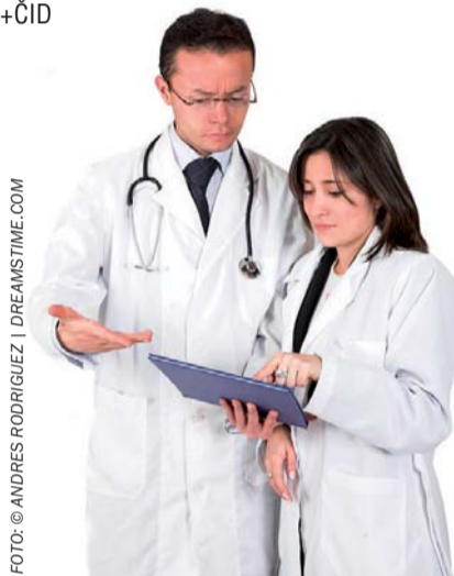
jištění moderní právní předpis, který respektuje pokroky v medicíně.

profil funkčních schopností jedince, důsledky zdravotních postižení na pracovní schopnost a následně cíleně kompenzovat pokles jeho pracovní schopnosti odpovídající invaliditě. Odborným garantem vyhlášky se stala Česká lékařská společnost J. E. Purkyně, jejímuž vedení a předním odborníkům jednotlivých lékařských oborů je nutno poděkovat za dlouhodobou spolupráci na přípravě vzniku nové právní úpravy. I když nová právní úprava byla přijata v době, kdy se ve společnosti hledají cesty k dosažení úspor ve veřejných financích, jejím záměrem nebylo ani není „ušetřit na zdravotně postižených“, ale po cca 15 letech poskytnout posudkové služby sociálního zabezpečení (která je kompetentní posuzovat invaliditu) a pojištěncům systému důchodového po-