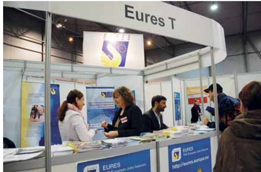
O možnostech práce v zahraničí se můžete informovat na obou veletrzích u stánků EURES.

V Praze v areálu PVA EXPO v Letňanech se 23. a 24. října uskuteční další ročník jednoho z největších veletrhů práce Profesiadays 2013 . Pořádá ho společnost Profesia, která již 16 let provozuje pracovní portály ve střední Evropě. Tento veletrh klade důraz na osobní setkání zaměstnavatelů, uchazečů, odborníků