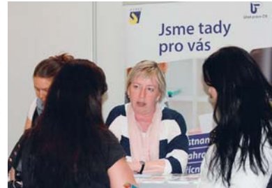
Poradci ze sítě EURES informovali návštěvníky veletrhu o možnostech pracovního uplatnění v zahraničí.

Veletrhu se zúčastnili poradci EURES z České republiky, ale také jejich kolegové z Dánska, Itálie, Německa, Nizozemska, Slovenska a Švédska. Uchazečům nabízel informace o životních a pracovních podmínkách v jednotlivých zemích, ale také ověřená volná pracovní místa v různých oborech. Za