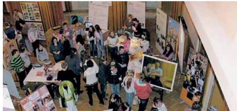
Letošní Akademie řemesel se koná 22. října v Sokolovně Rokycany v Jiráskově ulici 208 od 9 do 15 hodin.

V rámci Roku průmyslu a technického vzdělávání pořádá 22. října Kontaktní pracoviště Úřadu práce ČR v Rokycanech ve spolupráci s partnery 10. ročník prezentace středních škol a zaměstnavatelů z Rokycanska – Akademie řemesel 2015.