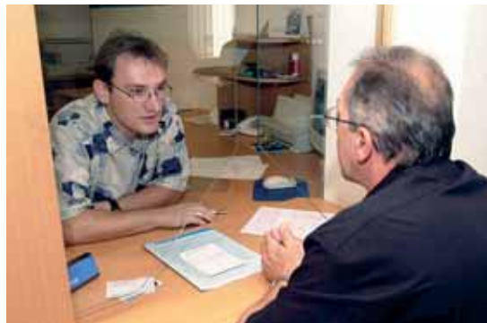
Aby neutrpěla kvalita poskytovaných služeb, měl by být letos navýšen počet zaměstnanců Úřadu práce ČR.

Poddimenzovanost sekce nepojistných sociálních dávek, rozpočtová situace, posílení aktivní politiky zaměstnanosti, informační systémy. To byla také hlavní témata, o nichž diskutovali ředitelé krajských poboček a kontaktních pracovišť Úřadu práce ČR (ÚP ČR) na dvouhodinné celostátní poradě v Brně 19. a 20. prosince loňského roku. Účastníci celostátní porady se v neposlední řadě zabývali i problémy, které se vyskytly při vyplácení dávek a jež se díky obrovskému úsilí a pracovnímu nasazení zaměstnanců Úřadu práce ČR podařilo v krátkém čase vyřešit. Celostátní porada vedení Úřadu práce ČR se koná vždy jednou za čtvrt roku. Tě poslední se zúčastnilo přibližně 90