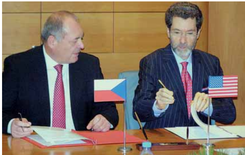
Jednání ministra Františka Koníčka a velvyslance Normana L. Eisena se neslo ve velmi přátelském duchu i proto, že rodinné kořeny pana velvyslance sahají do bývalého Československa a on sám hovoří plynně česky.

Ministr práce a sociálních věcí František Koníček podepsal 24. září spolu s americkým velvyslancem v České republice Normanem L. Eisenem dodatek k bilaterální Smlouvě o sociálním zabezpečení, který usnadní ekonomickou spolupráci mezi oběma zeměmi.