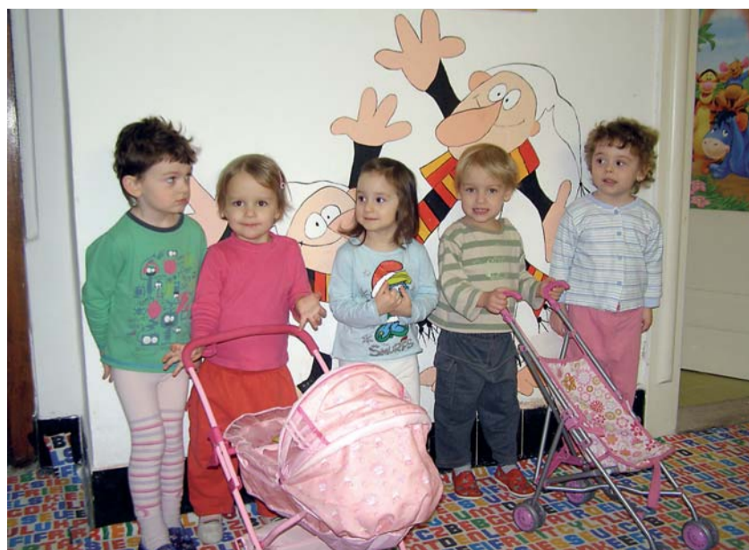
Na Ministerstvu práce a sociálních věcí ČR fungují v pilotním provozu dvě tzv. dětské skupiny. První využívají rodiče a děti od července 2011, druhá nabízí služby od února letošního roku.

Právní předpis o tzv. dětské skupině vychází z programového prohlášení vlády. Ministři se v něm zavázali, že podpoří rozvoj alternativních předškolních zařízení a budou vytvářet podmínky pro rychlejší návrat rodičů pečujících o děti do práce. (TZ)