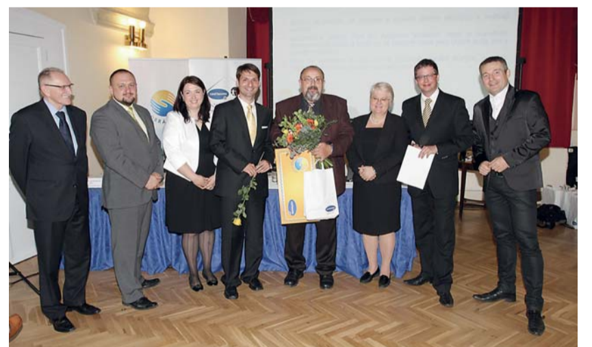
Ocenění Dobrá duše v kategorii Instituce získal Dům Sv. Antonína z Moravských Budějovic.