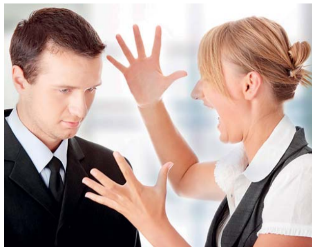
Mezi základní témata vzdělávání klíčových zaměstnanců a inspektorů na Státním úřadu inspekce práce patří i řešení konfliktů.

Vzdělávání klíčových zaměstnanců Státního úřadu inspekce práce v měkkých dovednostech probíhá již od září 2012, a to v rámci projektu financovaného z Operačního programu Lidské zdroje a zaměstnanost pod názvem Zavedení modelu kvality řízení CAF a rozvoj výkonnosti zaměstnanců v rámci Státního úřadu inspekce práce.