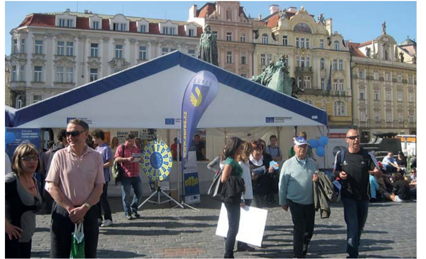
Letos se oslavy Dne Evropy v ČR konaly v Praze na Staroměstském náměstí i v Ostravě na Jiráskově náměstí (tzv. Kuřím rynku).

Oslavy Dne Evropy se konají na veřejných prostranstvích evropských měst každý rok. V tento den si obyvatelé jednotlivých členských zemí připomínají své evropské občanství a práva, která jsou s tím spojena. Evropská představitel rozhodli o zavedení svátku Dne Evropy na Milánském summitu v roce 1985. Svátek má mimo jiné zdůraznit fakt, že každá země, která se dobrovolně rozhodla vstoupit do EU, se zároveň zavázala ctít a prosazovat základní hodnoty společenství.