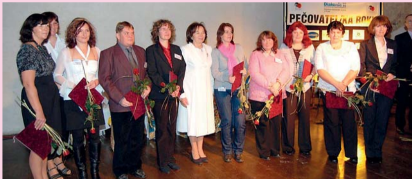
Záštitu nad soutěží převzala manželka prezidenta republiky Livia Klausová.

Akce není pojímána jako soutěž či klání, ale spíše jako příležitost poděkovat a veřejně ocenit práci pečova-