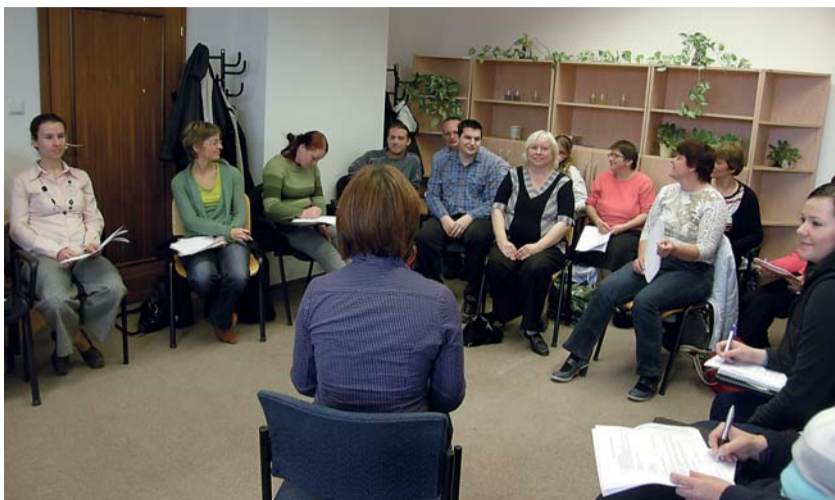
V Hradci Králové byl velký zájem i o seminář věnovaný přijímacímu pohovoru a seminář o pracovním právu.

Motivovat dospělé k dalšímu vzdělávání měla akce s názvem Týden vzdělávání dospělých, která se už pátým rokem konala v jednom z listopadových týdnů v Královéhradeckém kraji. Nezaměstnaní, studenti a další dospělí mohli navštívit vzdělávací akce a bezplatné ukázkové lekce.