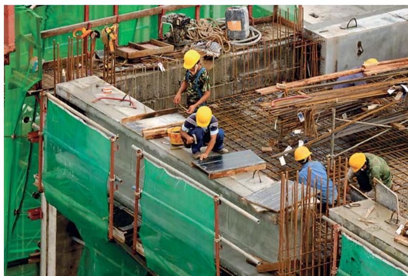
Kontroly Úřadu práce v Ostravě se zaměřily také na nelegální zaměstnávání cizinců, občanů ČR i jiných zemí EU.