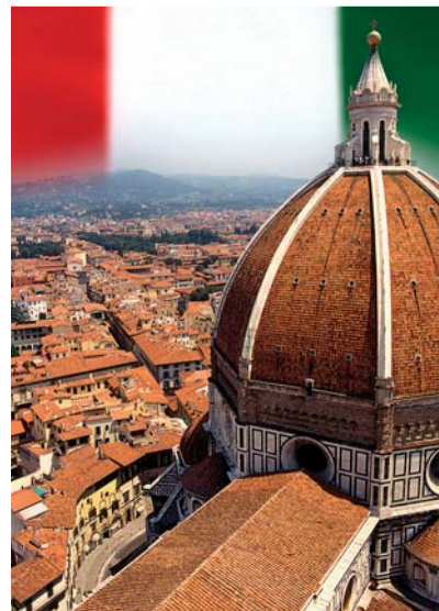
2X FOTO: © STEVE ALLEN | DREAMSTIME.COM