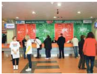
EURES poradci na veletrhu odpovídali i na otázky týkající se otevření německého trhu práce od 1. května 2011.

EURES (Evropské služby zaměstnanosti) byl jedním z partnerů a vystavatelů na největším veletrhu vzdělávání a pracovních příležitostí v severních Čechách EDUCA 2010 JOBDAYS Liberec, který se konal již čtvrtým rokem v liberecké Tipsport aréně od 21. do 23. října. Návštěvnost veletrhu se za celé tři dny přiblížila hranici 10 tisíc návštěvníků. EURES oslovilo okolo 300 zájemců o zaměstnání v zahraničí, převážoval zájem hlavně o práci v německém příhraničí. EURES poradci například odpovídali na dotazy týkající se pracovního povolení a otevření německého trhu práce od 1. května 2011.