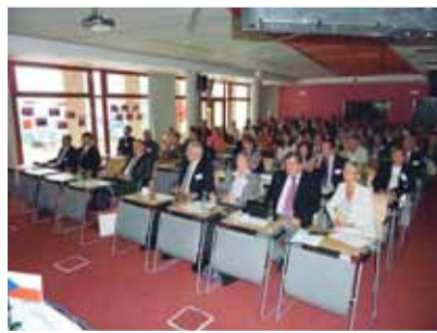
Konference EURES přilákala do Sychrova na 75 účastníků, především ředitelů úřadů práce a pracovníků úřadů práce zabývajících se tematikou práce v zahraničí.