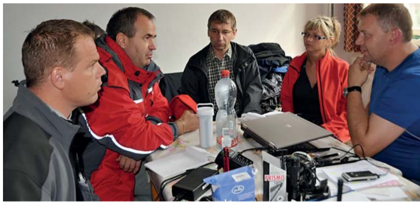
Zaplavenou oblast na Liberecku navštívil i ministr práce a sociálních věcí Jaromír Drábek (uprostřed).