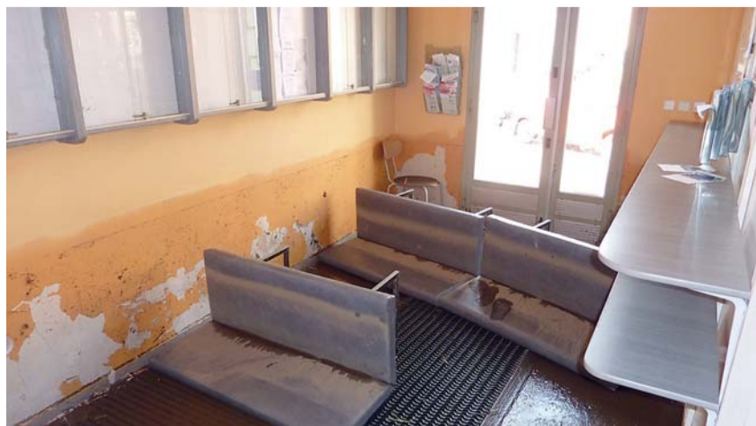
Povodně se nevyhnuly ani pobožce libereckého úřadu práce ve Frýdlantu.