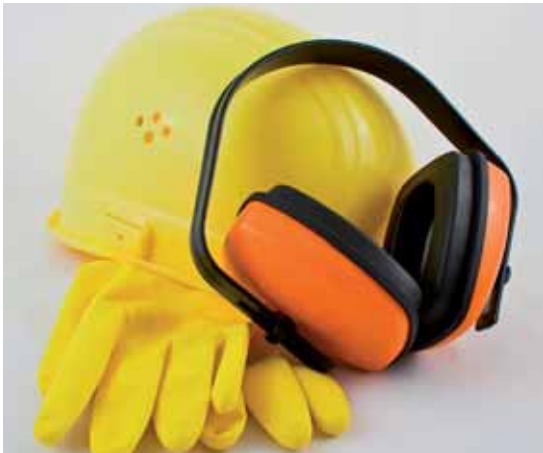
Osobní ochranné pracovní prostředky jsou ochranné prostředky, které musí chránit zaměstnance před riziky, nesmí ohrožovat jejich zdraví, nesmí bránit výkonu práce a musí splňovat požadavky nařízení vlády č. 21/2003 Sb., které je prováděcím nařízením k zákonu č. 22/1997 Sb.

Poskytování OOPP zaměstnavatelem je dále zaznamenáno do osobních karet nebo vedeno v samostatné evidenci. Evidence přítom v mnohých případech bývá právě v rozporu s požadavky směrnice pro poskytování OOPP, kdy tato stanovuje způsob, který není vyhovující pro daný subjekt.