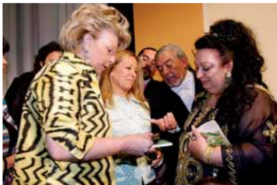
Viviane Redingová, místopředsedkyně Evropské komise a eurokomisařka zodpovědná za spravedlnost, základní práva a občanství (první zleva), a Trinidad Jiménezová, španělská ministryně zdravotnictví a sociální politiky, v rozhovoru se skupinou romských hudebníků na druhém evropském summitu o Romech, který se letos konal 8. a 9. dubna ve španělském městě Córdoba.

fondů, které společně představují téměř polovinu rozpočtu EU, na podporu začleňování Romů;