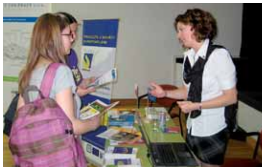
V Českých Budějovicích se prezentovaly i Evropské služby zaměstnanosti (EURES).

Pokračování veletřu JOBDAYS 2010 se uskutečnilo 20. dubna v aule Jihočeské univerzity. Především pro studenty Ekonomické fakulty JU, na které byla akce zaměřena, představoval jedinečnou možnost, jak se setkat s potenciálními zaměstnavateli. Akce se účastnilo celkem 14 vystavovatelů. Kromě soukromých firem se zde prezentovaly Evropské služby zaměstnanosti (EURES) a Evropských sociální fond.