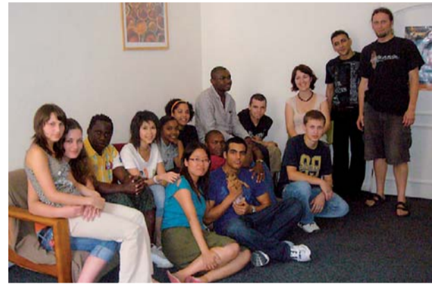
Fotografie z letního kurzu českého jazyka pro cizince