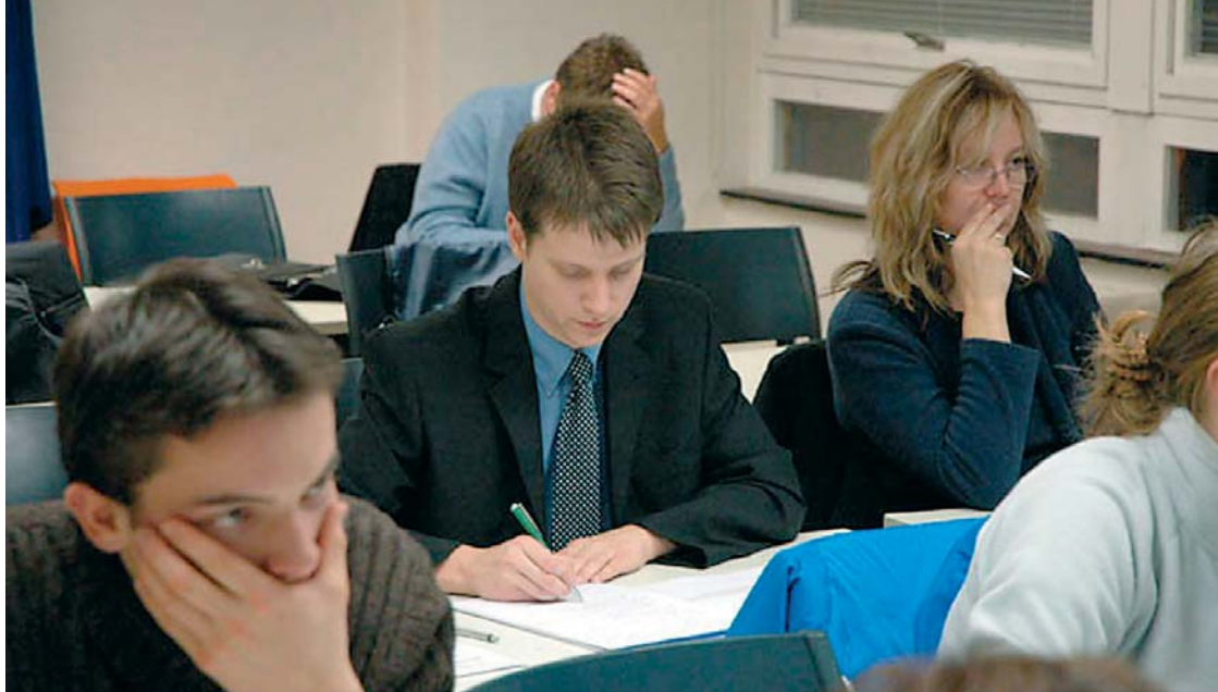
Z workshopu, který se konal v rámci projektu Centra inovativního vzdělávání na Pedagogické fakultě Univerzity Palackého.

Kdo vám může pomoci? Různé nadace, správní orgány, Evropská unie, ambasády, zahraniční kulturní instituty, soukromí nebo individuální dárci. Projekt má tím větší šanci na úspěch, čím více má dárců. Nejen peněžní pomoc je hodna ocenění. Dobrovolnická troška do mlýna naznačuje, že vaše vize nadchla, že je kvůli ní někdo ochoten pracovat