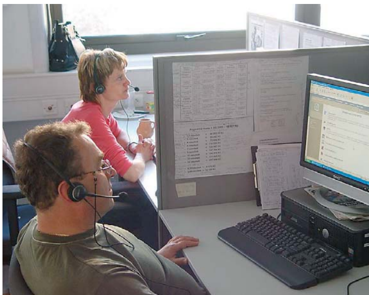
Zodpovězené dotazy kontaktním centrem MPSV dělené dle jednotlivých problematik