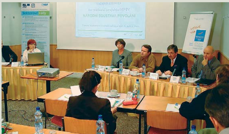
Podobu Národní soustavy povolání představili 5. dubna na tiskové konferenci zástupci realizátorů veřejné zakázky projektu MPSV – sdružení TREXIMA, spol. s r. o., Hospodářské komory ČR, Institutu Svazu průmyslu ČR a Svazu průmyslu a dopravy ČR.

Národní soustava povolání se stane efektivním flexibilním nástrojem státu pro rozvoj lidských zdrojů a profesního vzdělávání, posílí roli zaměstnavatelů v této oblasti a stane se základnou pro budoucí mobilitu a flexibilitu na trhu práce v kontextu celé EU.