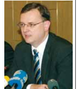
vajícího zákona by vedlo ke kolapsu sociálních služeb a k obrovskému nárůstu veřejných výdajů.

Nadále trvají tři základní priority našeho ministerstva, tzn. za prvé důchodová reforma, za druhé vytvoření moderní prorodinné flexibilní politiky a za třetí reforma sociálního systému spojená s trhem práce tak, aby sociální systém motivoval k práci, nikoli k nepráci. Vedle toho nás čekají některé kroky, se kterými jsme ještě minulý rok nepočítali, jako např. nutná razantní reforma systému sociálních služeb, protože se ukazuje, že pokračování současného fungování systému sociálních služeb podle stá-