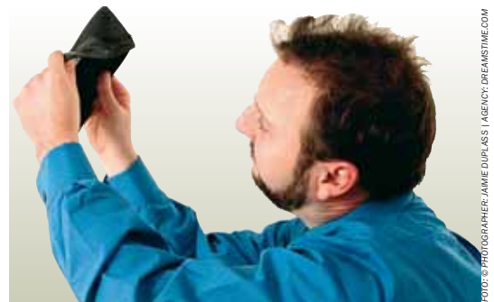
Na prázdnou peněženku si budou muset zvyknout ti, kteří jen zneužívají záchytovou síť sociálních dávek a nechtějí pracovat.

V čem tkví podstata změn? V jednoduchém klíči: ruší se přímá návaznost většiny sociálních dávek na výši životního minima. Znamená to, že dávky životního a existenčního minima budou napříště chápány jako ochrana těch, kteří pomoc skutečně potřebují, nikoli jako základ pro výpočet dalších dávek. Odstraňuje se tím každoroční automatická valorizace všech dávek kromě důchodů. Vláda bude mít možnost životní minimum zvýšit, nebude to ale její povinnost. Právě nebezpečný princip na-