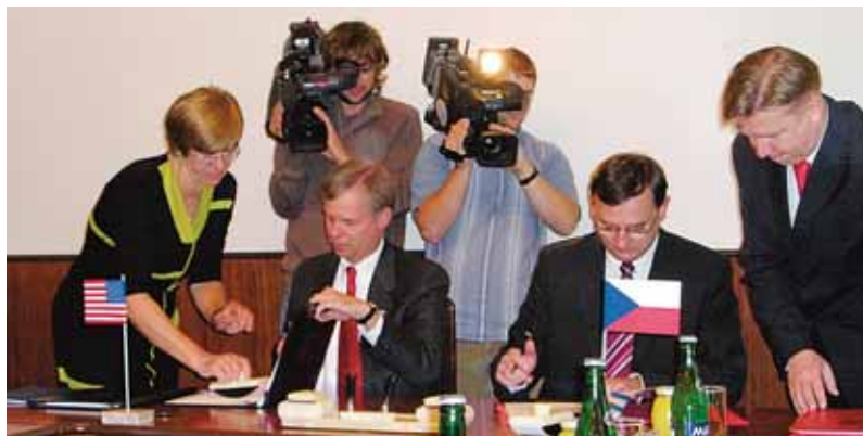
Velvyslanec USA v ČR Richard Graber a vicepremiér a ministr práce a sociálních věcí ČR Petr Nečas podepsali česko-americkou dohodu o sociálním zabezpečení 7. září v budově Ministerstva práce a sociálních věcí ČR v Praze 2, Na Poříčním právu 1.

Velvyslanec USA v ČR Richard Graber a vicepremiér a ministr práce a sociálních věcí ČR Petr Nečas podepsali dohodu, která seje za občanů povinnost plátb sociálního pojištění v obou zemích současně. Občané USA pracující pro americké společnosti v České republice, stejně jako čeští občané pracující pro české firmy v USA, musejí podle platné legislativy plátb sociální pojištění v obou zemích.