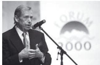
Konference Forum 2000 se koná již tradičně pod záštitou bývalého prezidenta ČR Václava Havla.

Pozvání na konferenci přijali přes čtyři desít-