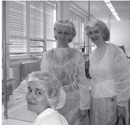
Není výjimkou, že se účastníci projektu během čtyřměsíční pracovní praxe osvědčí a získají nabídku na trvalé zaměstnání.

Pan M. má věk kolem 40 let, na úřadu práce je evidován sedm let. Je vyučen obuvníkem ve Snaze Brno (dvouletý učební obor). Má zdravotní problémy se srdcem a z toho