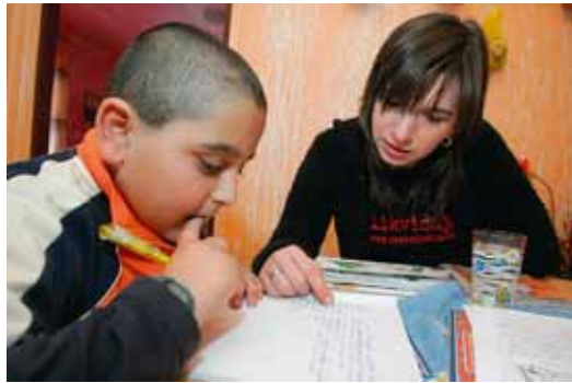
Program individuálního doučování má za cíl systematicky pracovat s dětmi i rodiči ze socio-kulturně znevýhodněného prostředí.

Počet chudinských enkáv v České republice stále roste. Dokládají to i výsledky výzkumu sociálně vyloučených romských lokalit v ČR, který pro MPSV realizovala společnost GAC, spol. s r. o., ve spolupráci s Novou školou a který byl realizován díky prostředkům Evropského sociálního fondu. Ty byly na závěrečné konferenci oficiálně zveřejněny 6. září t. r. a hovoří o 310-330 takových lokalitách. Většina jejich obyvatel jsou Romové, někteří sebeidentifikovávají, ale v převážné většině je jako „Romy“ roze-