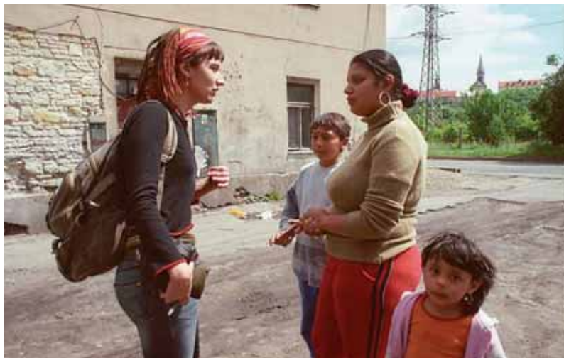
Sociální pracovníci Člověka v tísni pomáhají jen těm klientům, kteří dodržují kontrakt o spolupráci, aktivně se podílejí na zlepšení své situace a neporušují zákony.

řňovaných metod je poměrně široký. Nejvíce vyhledávána je pomoc s administrativními úkony a vyjednáváním na úřadech, doprovod na jednání, bezplatné právní poradenství, asistence při zajištění příjmů, problémech s bydlením či vzděláváním dětí, vyjednávání o splnění dluhů a sestavování splátkových kalendářů. Právní poradenství zajišťuje v rámci Programů sociální integrace pět právníků. Sociální pracovníci mohou sítování a zprostředkováním kontaktů s dalšími profesionály klientům pomoci zvýšit si osobní kvalifikaci či si najít zaměstnání. Nově jsou navíc v některých městech k dispozici pracovní poradci Člověka v tísni, se kterými sociální pracovníci spolupracují. Vybrané problémy pracovníci konzultují s odborníky z oblasti sociální práce, právníky, lékaři, rodinnými či pedagogickými poradci, odborníky na protidrogovou prevenci a léčbu závislosti a podobně. Udržují kontakt s místními subjekty, které pracují ve zmiňovaných a příbuzných oblastech, a v případě potřeby klientům s nimi zprostředkovávají kontakt.