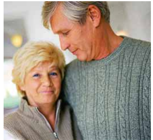
Při odpovědném přístupu je možné i podzim života strávit bez zbytečných finančních potíží.