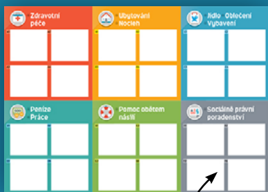
Předtiskávaná šablona letáku

Samolepící štítky s kontakty, které jste doplnili