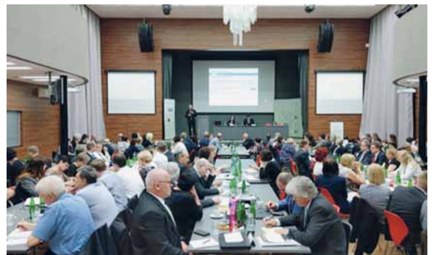
Celorepublikové setkání vedení ústředí České správy sociálního zabezpečení a všech okresních správ sociálního zabezpečení, kterého se zúčastnila i ministryně práce a sociálních věcí Jaroslava Němcová, se konalo 16. a 17. dubna.