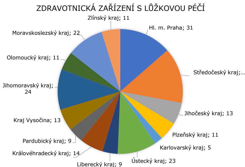
Graf č. 3 Počty oslovených zdravotnických zařízení v krajích ČR (2019)

Zdroj: Data ze Sčítání osob bez domova 2019, N = 229; podíly viz Nešporová et al. 2019, 29.