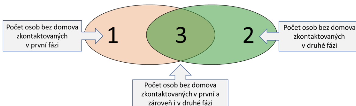
Diagram č. 1 Znázornění průniku sečtených skupin osob při použití metody Capture-mark-recapture

Pouze díky znalosti těchto tří údajů lze dopočítat odhad celé bezdomovecké populace ve vašem městě.